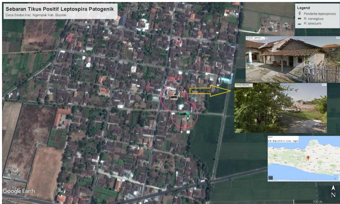
Gambar 2. Peta Sebaran Tikus Positif Leptospira sp. di Desa Sindon Kecamatan Ngemplak Kabupaten Boyolali Tahun 2014